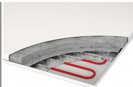
Maksimal oppvarmingseffekt, takket være dobbel varmeisolasjon, som forhindrer varmetap på baksiden