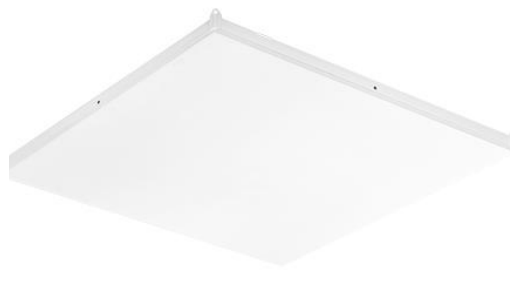
300W Art. nr.: TOTS-HV-0300 L59,2 x B59,2 x D3,5cm 600W Art. nr.: TOTS-HV-0600