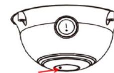
Knapp på undersiden