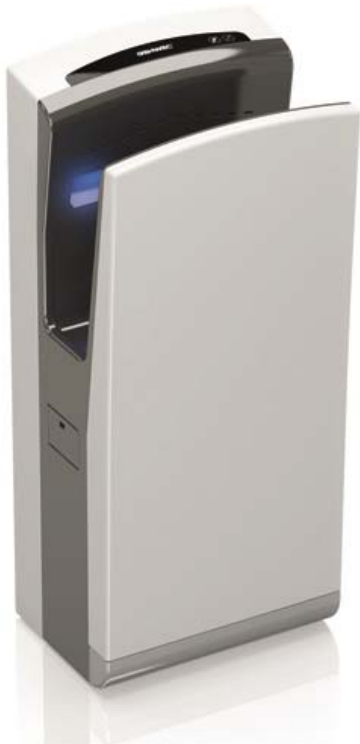
Art. nr.: HTJP-HV-1650 El-nr.: 58 662 23 GSIN-nr.: 7072395000234