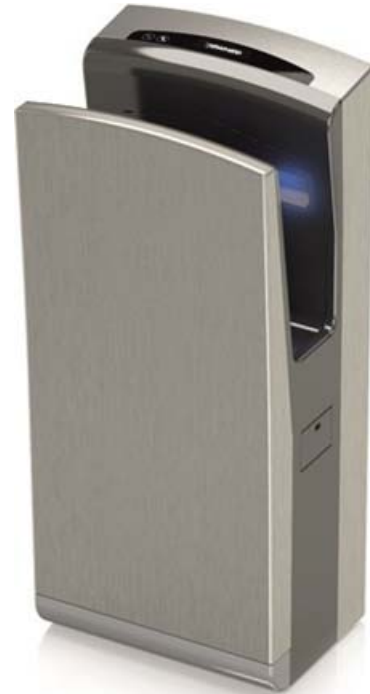
Art. nr.: HTJP-BS-1650 El-nr.: 58 662 24 GSIN-nr.: 7072395000241