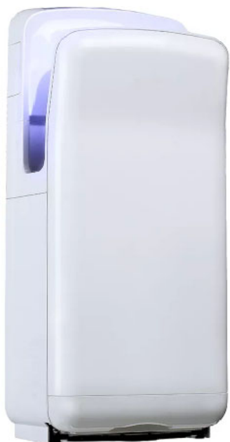
Art. nr.: HTAP-HV-1900 El-nr.: 58 662 09 GSIN-nr.: 7072395000098