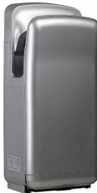
Art. nr.: HTAP-SL-1900 El-nr.: 58 662 19 GSIN-nr.: 7072395000197