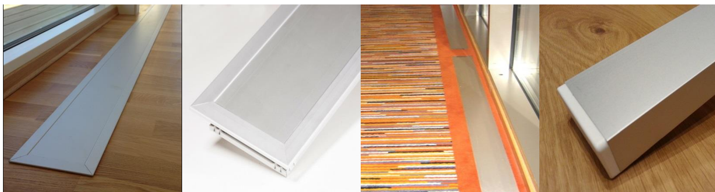
E-100 med ramme nedfelt i parkett

Varmelist uten ramme festes til underlaget med tilhørende festebraketter eller borrelås, evt. felles ned på lik linje med varmelist med ramme, men det kreves da større presisjon når utsparringen lages.